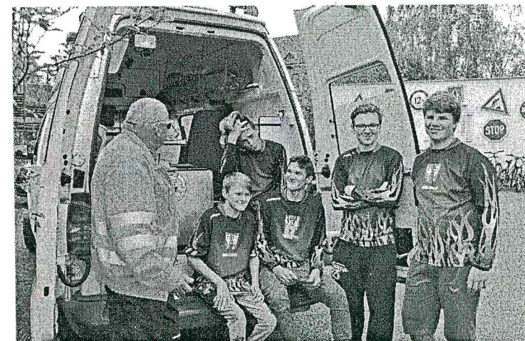
Ve starší kategorii zvítězili a do krajského kola postupují kluci z SDH Březnice

ného – někdy dělá potíže i volání záchranky a popis situace. Znalosti samozřejmě také odpovídají tomu, jak často se v kroužcích scházejí, kolik času je kurzům první pomoci věnováno. Co mám vyzorováno, mladší děti jsou bezprostřední,