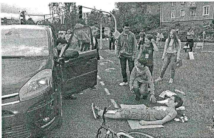
Případy byly samozřejmě fingoané, ale ruku na srdce, dokázali byste si ve skutečnosti poradit?