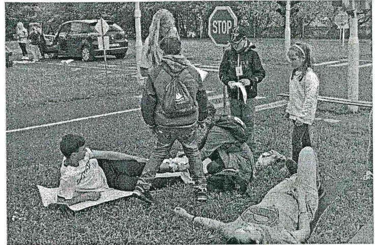
Solenický tým v akci

ale jak to vidí odborník? „Děti většinou mají ze svých škol dobré teoretické znalosti. Ovšem přestup do reálné situace je komplikovaný. Mají problém rozhodnout se, naučit se komunikovat, vyšetřit zraně-