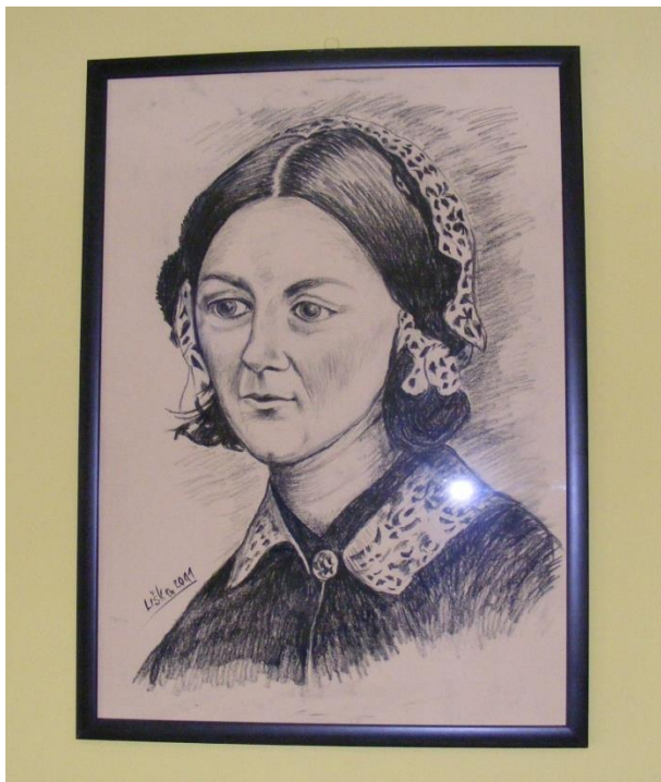
Galerie historických osobností, SZŠ a VOŠZ Příbram

Připomeňme také, že se Florence postavila za ženská práva ve své knize Názor na hledání náboženské pravdy . Dožila se i prvního kongresu Mezinárodní rady ošetřovatelek, který se uskutečnil v roce 1904 v Berlíně. Florence Nightingalová zemřela 13. srpna 1910. Jejího pohřbu se zúčastnily tisíce lidí.